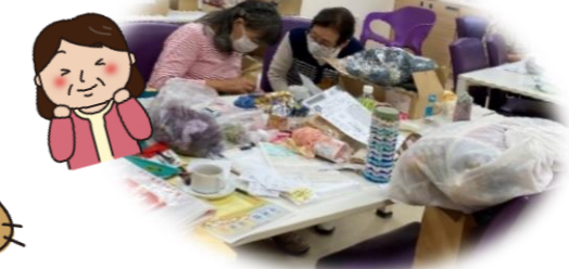
編み物広場に通り始め…