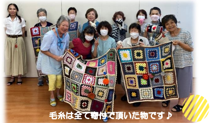
糸は全て寄付で頂いた物です♪

メンバーの皆さん一人一人がモチーフを作り、丁寧につなぎ合わせ、とってもかわいいフレンドシップひざ掛けが出来上がりました♪ 寒くなる前にケアマフと一緒に地域の福祉施設にお届けしたいと思っております♪